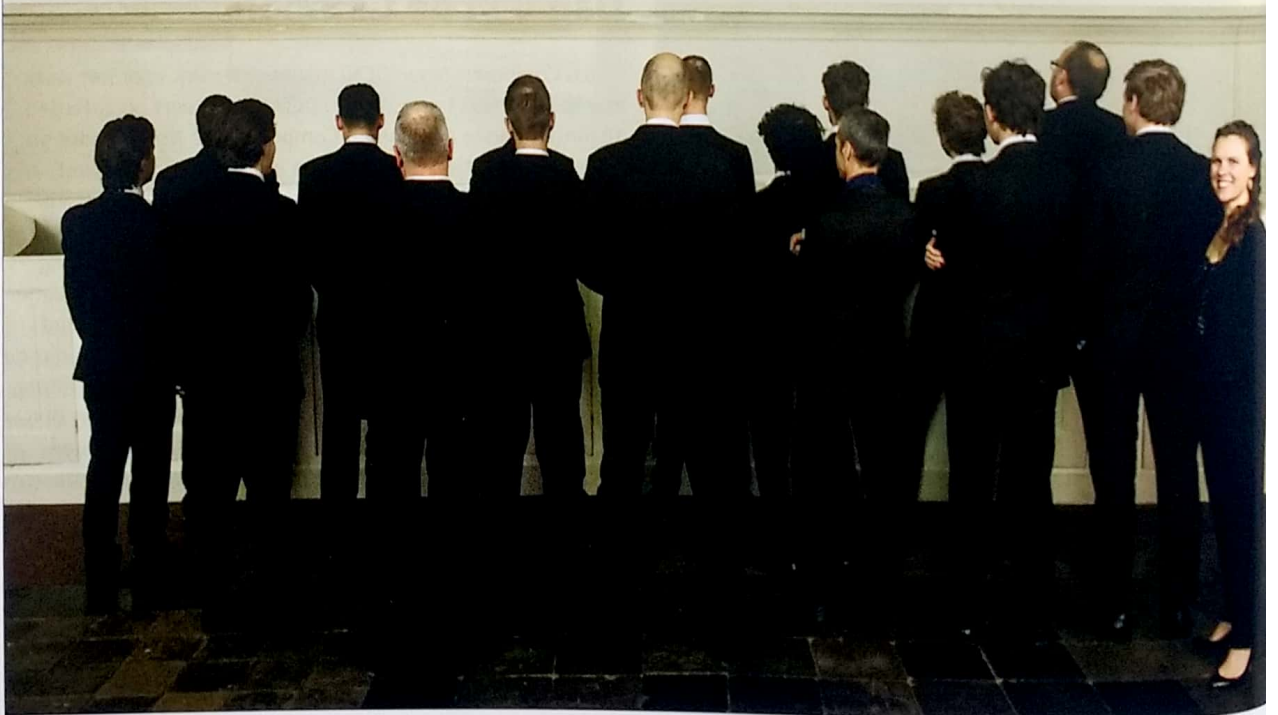
THE GENTS